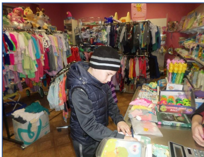
Опрос продавцов. Сентябрь, 2017 год